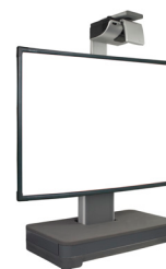
Интерактивная система ActivBoard 500 Pro Mobile с проектором EST-P1