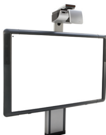
Sistema di supporto regolabile per ActivBoard 500 Pro con proiettore EST-P1