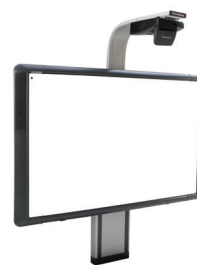
Sistema di supporto regolabile per ActivBoard 500 Pro con proiettore UST-P1