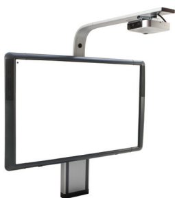
Sistema di supporto regolabile per ActivBoard 500 Pro con proiettore PRM-45