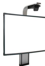
Système ajustable ActivBoard Touch avec vidéoprojecteur UST-P1