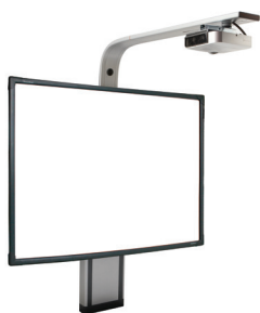
Système ajustable ActivBoard Touch avec vidéoprojecteur PRM-45