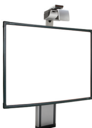
Système ajustable ActivBoard Touch avec vidéoprojecteur EST-P1