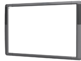
ActivBoard 500 Pro