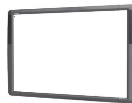
ActivBoard 500 Pro